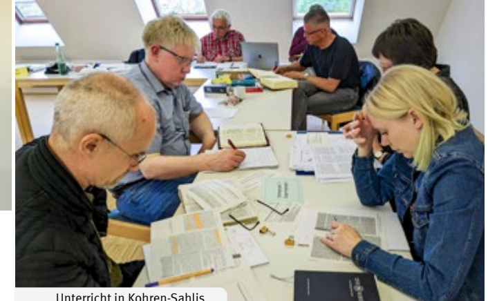
Unterricht in Kohren-Sahlis

Anmeldeschluss für Kurs 33 ist der 30. Juni 2024.