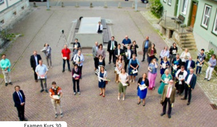
Examen Kurs 30